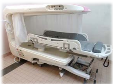
入浴機器 (オープン型シャワーバス)