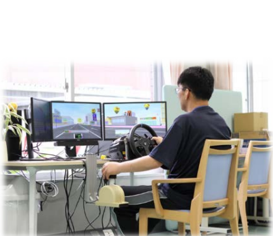
ドライブシュミレーター